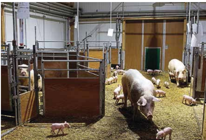
Ruhige Bucht zum Abferkeln und Platz für Bewegung und Begegnung